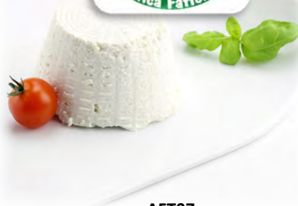
AFT07 RICOTTA DI BUFALA 100% 500 G ANTICA FATTORIA (Carton x4)