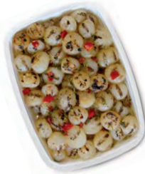
FCN0254 POIVRONS GRILLÉS BARQUETTE 1KG FACINO