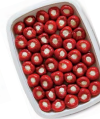
FCN0524 PETITS PIMENTS AU FROMAGE BARQUETTE 1KG FACINO