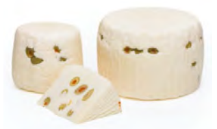
LCV08 FORMAGGIO CON OLIVE 1KG LA CAVA