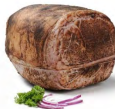
WLM013 JAMBON DE YORK GRILLE DEGRAISSE 7,5KG WILLIAM