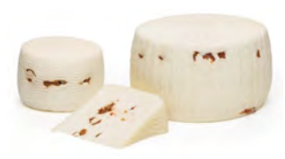
LCV06 FORMAGGIO CON POMODORI SECCHI (Tomate Séchée) 1KG LA CAVA