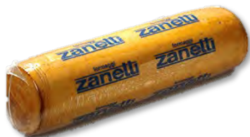
ZNT305 PROVOLONE FUME 3,7 KG ZANETTI (Carton x2)