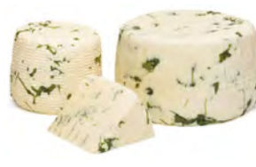
LCV05 FORMAGGIO CON RUCOLA (Roquette) 1KG LA CAVA