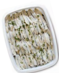
FCN0304 FILETS D'ANCHOIS MARINÉS BARQUETTE 1KG FACINO