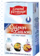
ERL06 Crème UHT Légère 18% MG 1L EURIAL (Carton x6)