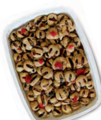
FCN0164 ARTICHAUTS GRILLÉS BARQUETTE 1KG FACINO