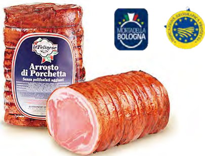
FLN47 ARROSTO PORCHETTA 6KG LA FELINESE (Carton x6)