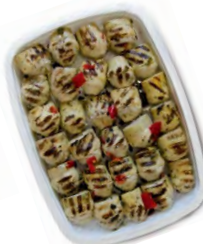
FCN0151 ARTICHAUTS AVEC PIEDS BARQUETTE 1KG FACINO