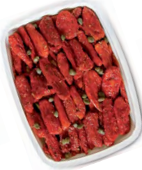
FCN0144 TOMATES SÉCHÉES BARQUETTE 1KG FACINO