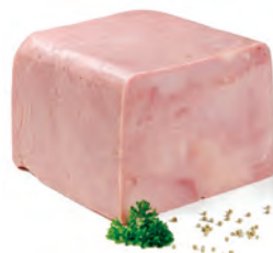
WLM020 EPAULE PICNIC DD WILLIAM 5KG WILLIAM