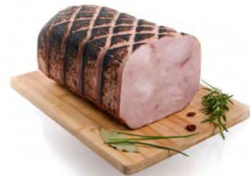
WLM011 JAMBONINO GRILLE 5KG WILLIAM