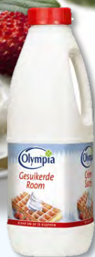
OLY275 CREME SUCREE 1,5L OLYMPIA (Carton x8)