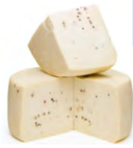
LCV01 FORMAGGIO PEPATO (Poivre) FRESCO 1KG LA CAVA