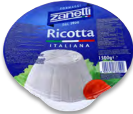
ZNT508 RICOTTA 1,5KG ZANETTI (Carton x2)