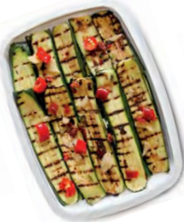
FCN0134 COURGETTES GRILLEES BARQUETTE 1KG FACINO