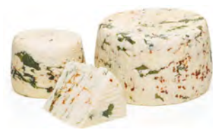
LCV07 FORMAGGIO AI SAPORI (Roquette/Olive/Piment) 1KG LA CAVA