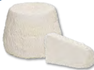
LCV10 RICOTTA SALATA 1,2KG LA CAVA (carton x12)