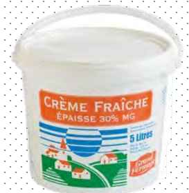
ERL05 CREME EPAISSE 30% MG SEAU 5L EURIAL