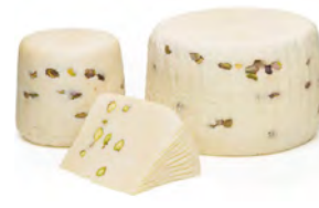
LCV03 FORMAGGIO CON PISTACCHIO (Pistache) 1KG LA CAVA