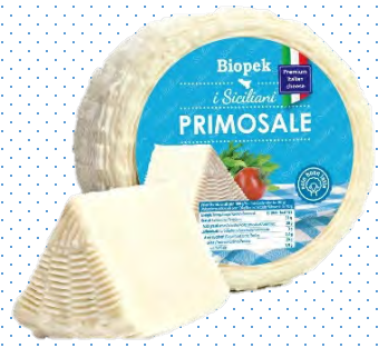
ZNT017 PRIMO SALE SICIL. BIANCO 1,3KG ZANETTI (Carton x6)