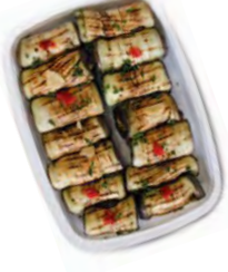
FCN0394 OIGNONS GRILLÉS BARQUETTE 1KG FACINO