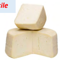
LCV02 FORMAGGIO FRESCO BIANCO (Nature) 1KG LA CAVA