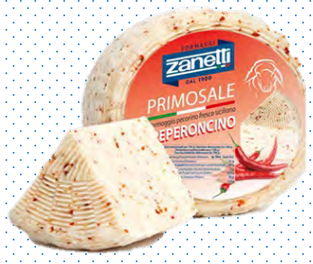
ZNT016 PRIMO SALE SICILIANO PIMENTS 1,3KG ZANETTI (Carton x6)