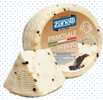
ZNT015 PRIMO SALE SICILIANO POIVRE 1,3KG ZANETTI (Carton x6)