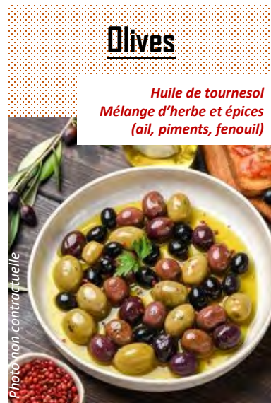
FCN100 MÉLANGE OLIVES VERTES ET NOIRES DÉNAUTÉES BARQUETTE 500G FACINO