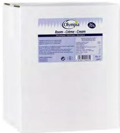
OLY100 CREME TOPCHEF 20% MG BIB 10L OLYMPIA