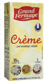
ERL04 Crème UHT 35% MG 1L EURIAL (Carton x6)