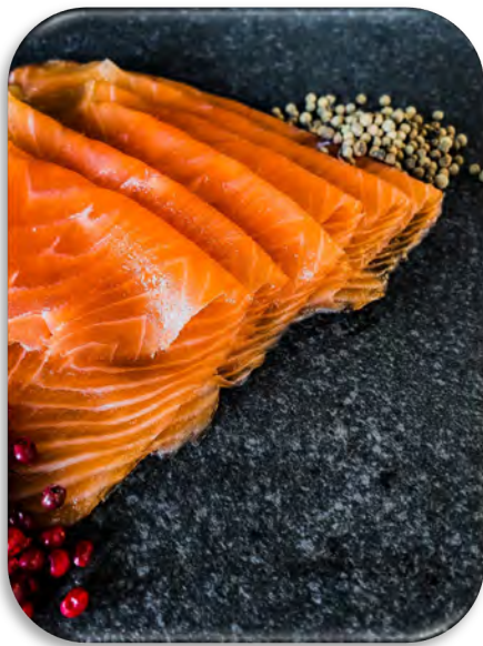
DWG01 SAUMON FUME PRETRANCHÉ NORVEGE 1,2KG STD DAWAGNE