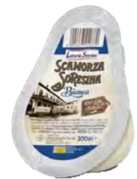
LSN51 SCAMORZA BLANCHE 300G LATTERIA SORESINA (Carton x9)