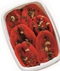
FCN0204 CHAMPIGNONS MIXTES BARQUETTE 1KG FACINO