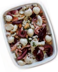
FCN0314 SALADE DE FRUITS DE MER BARQUETTE 1KG FACINO