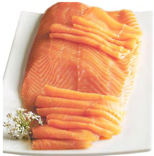
ATL01 SAUMON FUME PRETRANCHÉ NORVEGE +/-1KG ATLANTIK