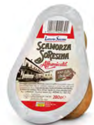
LSN21 SCAMORZA FUMÉE 280G LATTERIA SORESINA (Carton x9)