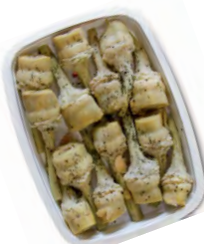
FCN0145 TOMATES DEMI-SÉCHÉES BARQUETTE 1KG FACINO