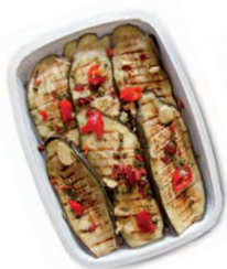
FCN0104 AUBERGINES GRILLEES BARQUETTE 1KG FACINO