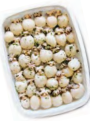
FCN0434 SALADE DE POULPE BARQUETTE 1KG FACINO