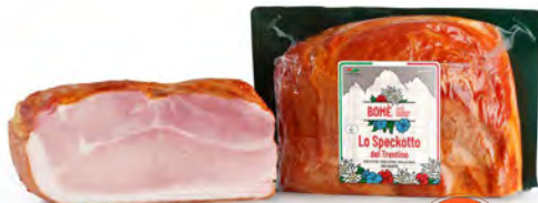
BOM0147 SPECKOTTO 1/2 3,5KG BOME (Carton x4)