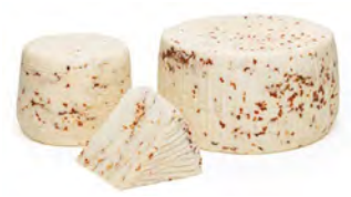
LCV04 FORMAGGIO CON PEPERONCINO (Piment) 1KG LA CAVA