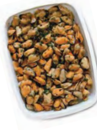
FCN0344 MOULES (sans coquillage) BARQUETTE 1KG FACINO