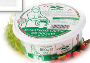
BSI01 MASCARPONE 500G BASSI (Carton x6)